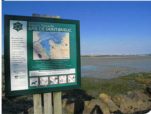
8 panneaux d'information