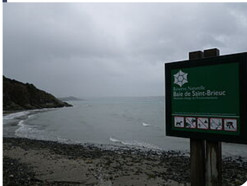
20 panneaux de limite