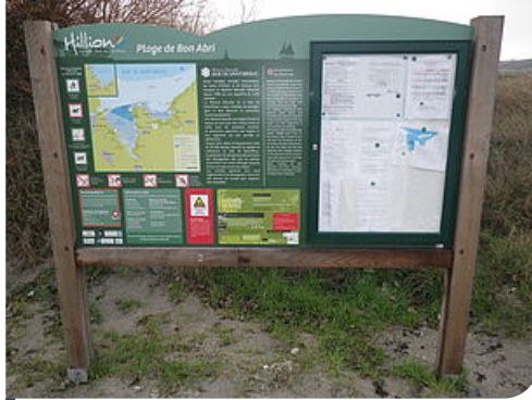
6 panneaux d'entrée de site