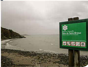
20 panneaux de limite