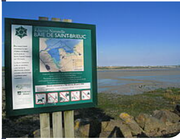
8 panneaux d'information