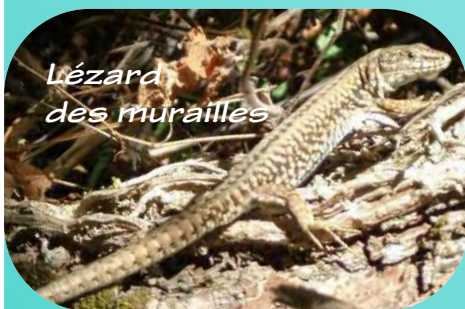
Lézard des murailles

Plus petits que les lézards verts et de couleur brune avec des points bleus sur le côté, nous affectionnons aussi les lieux secs et ensoleillés tels les murets exposés plein sud !