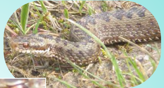
Pupille verticale chez la vipère

Pour grandir, nous avons besoin de muer par un changement de peau. Contrairement aux lézards qui perdent leur ancienne peau par petits morceaux, nous la perdons d'un seul tenant. La mue est aussi appelée «exuvie».