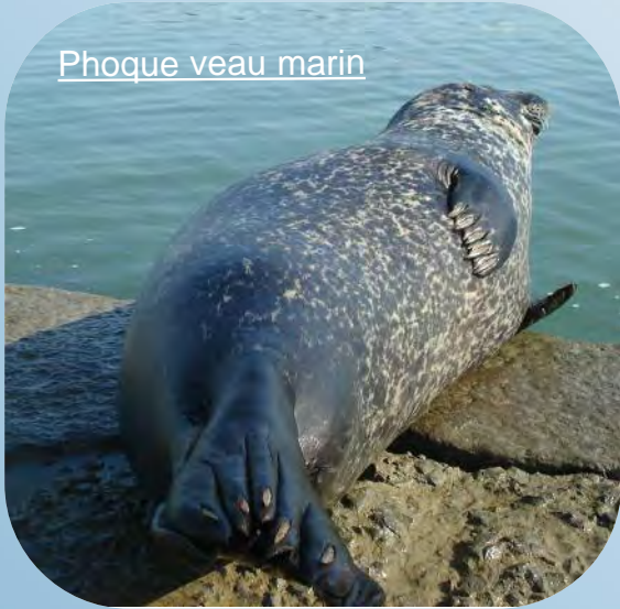
Phoque veau marin

Deux espèces de phoques fréquentent notre littoral : les phoques gris et les phoques veau marin (ou commun).