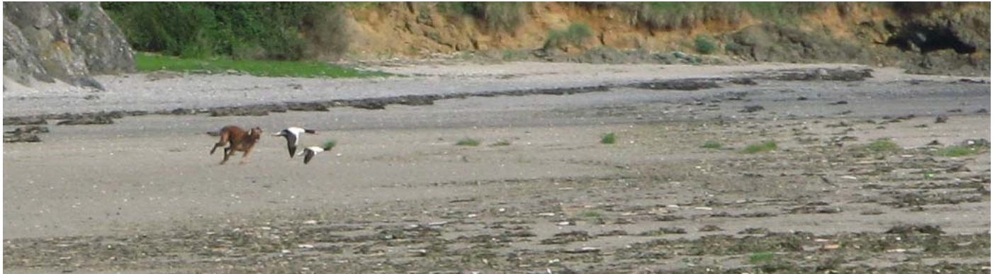
Chien non tenu en laisse courant après les Tadornes de Belon sur la plage de Bon Abri.

La période hivernale s'étend du 1 er octobre au 31 mars.