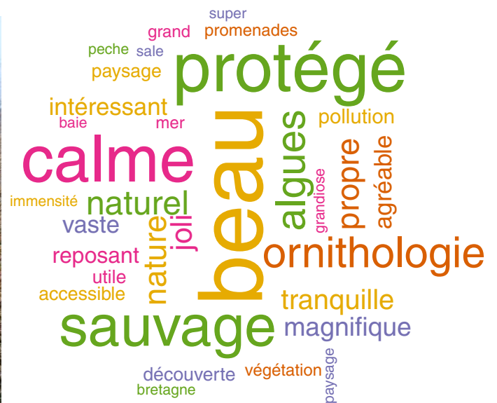
Nuage de mots les plus cité par les promeneurs.