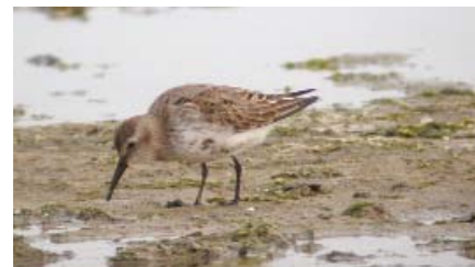
Devant les dunes de Bon-Abri, on peut observer des petits limicoles comme ce bécasseau minute