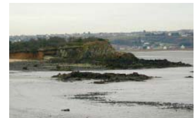
La pointe d'Illemont accueillera un observatoire ornithologique