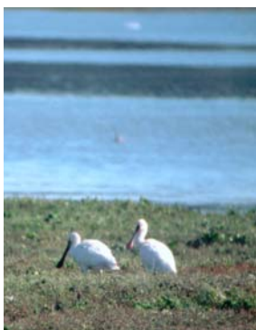
Spatules sur les grèves de Langueux