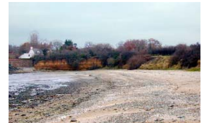
Plage de l'Hôtellerie

A proximité de la plage de l'hôtellerie (sur la pointe d'Illemont), un observatoire ornithologique est en projet pour 2006 dans le cadre du plan vert et bleu 3 de la CABRI.