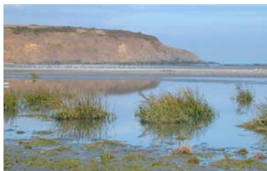
plage de Bon Abri