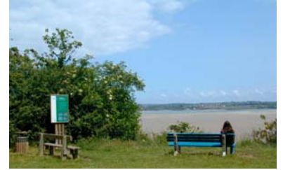
Pont de vue de la Cage

C'est l'endroit idéal pour observer de grands groupes de limicoles (bécasseaux, barges, courlis, huîtriers...).