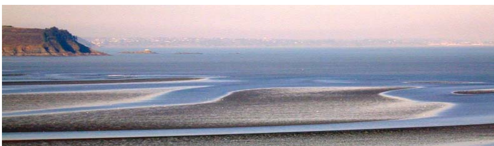
Point de vue de la pointe des Guettes