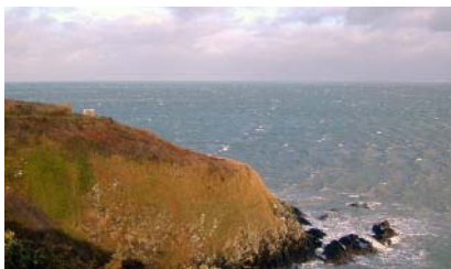
Pointe des Guettes à Hillion