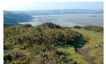
Côte de Morieux et de Planguenoual