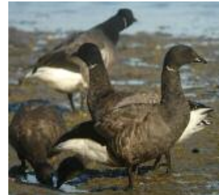
Groupe de Bernaches cravants

Plusieurs dizaines de Bernaches cravant viennent quotidiennement s'alimenter devant la plage de l'Hôtellerie à Hillion durant l'hiver. En restant calmement sur le trottoir il est alors possible de les observer de très près sans les déranger.