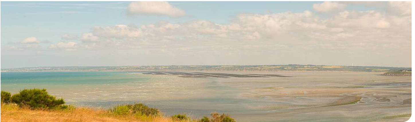
Point de vue depuis la pointe du Roselier