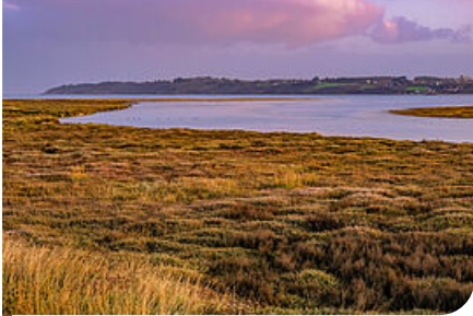
Le long des grèves de Languieux

La rue des Grèves lui exposera les couleurs argentées des prés-salés jusqu'à Yffiniac, point le plus au sud de la réserve. En prenant la direction de Hillion, passant à côté de multiples terrains cultivés gagnés jadis sur la mer, il pourra alors faire une halte à Pisse-Oison afin d'admirer le panorama de l'ensemble de l'anse et qui sait, peut-être apercevoir un phoque veau marin se prélasser au soleil.