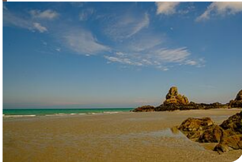
Plage de Béliard