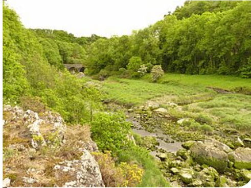
L'estuaire du Gouessant