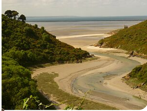
Saint-Maurice à l'embouchure de l'estuaire du Gouessant