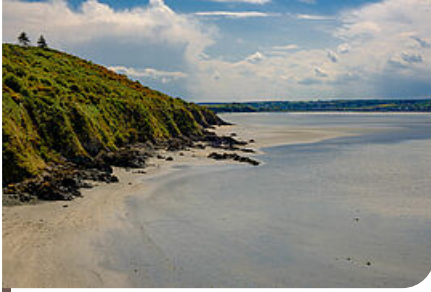
la côte d'Hillion

La suite du chemin n'est pas moins spectaculaire puisqu'il mène au bout de la presqu'île d'Hillion, à la Pointe du Groin puis à la Pointe des Guettes.