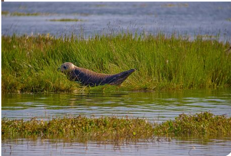
Le phoque veau-marin fréquente cette zone de tranquillité