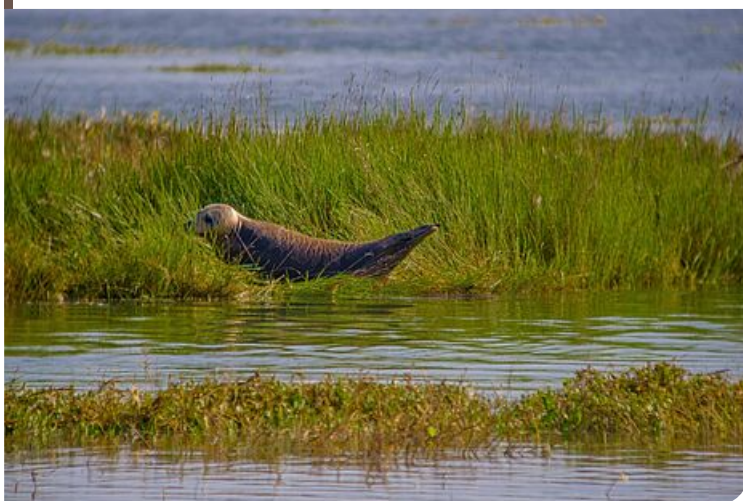
Le phoque veau-marin fréquente cette zone de tranquillité