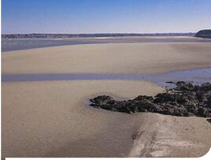
L'anse d'Yffiniac vue depuis la plage du Valais

Partant de Plérin, et plus particulièrement, de la pointe du Roselier, le randonneur qui marche vers le sud arrivera au port du Légué, au pied de la ville de Saint-Brieuc. Devant lui, la tour de Cesson, partiellement en ruine, domine l'estuaire du Gouët. En continuant son chemin, il arrivera en moins d'une heure à la plage du Valais et ces petits cabanons multicolores, limite Nord-Ouest de la réserve.