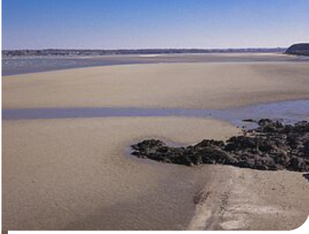
L'anse d'Yffiniac vue depuis la plage du Valais

Partant de Plérin, et plus particulièrement, de la pointe du Roselier, le randonneur qui marche vers le sud arrivera au port du Légué, au pied de la ville de Saint-Brieuc. Devant lui, la tour de Cesson, partiellement en ruine, domine l'estuaire du Gouët. En continuant son chemin, il arrivera en moins d'une heure à la plage du Valais et ces petits cabanons multicolores, limite Nord-Ouest de la réserve.