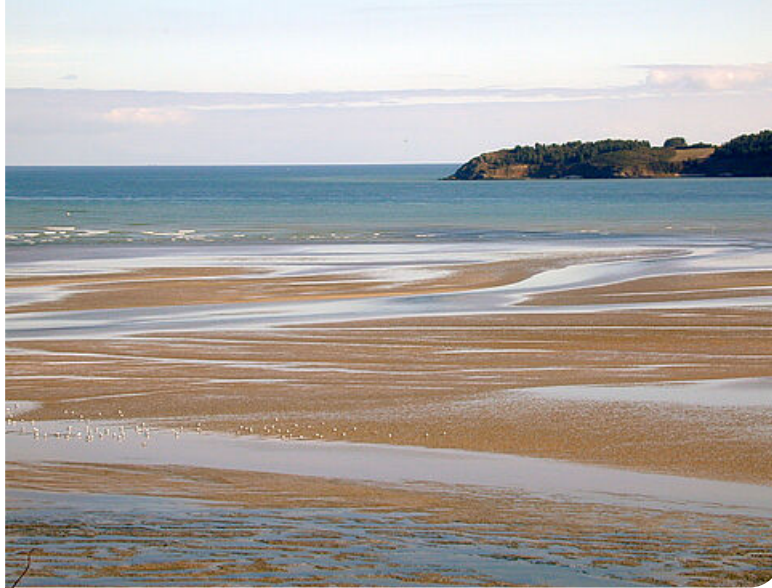
Le panorama de "la cage"