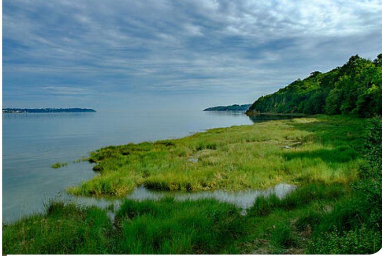
Pisse-oisin à marée haute