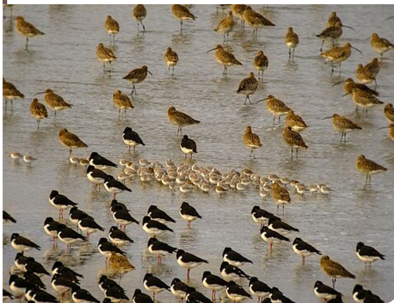
La cage domine le plus important reposoir d'oiseau de la baie de Saint-Brieuc