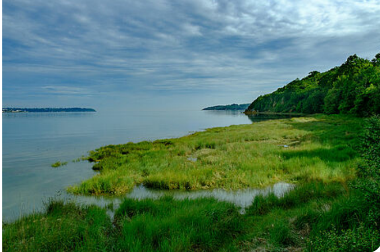
Pisse-oisin à marée haute