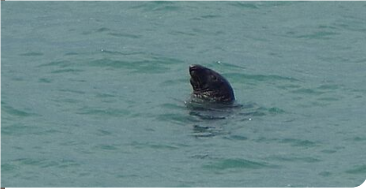
Phoque gris ( Halichoerus grypus )