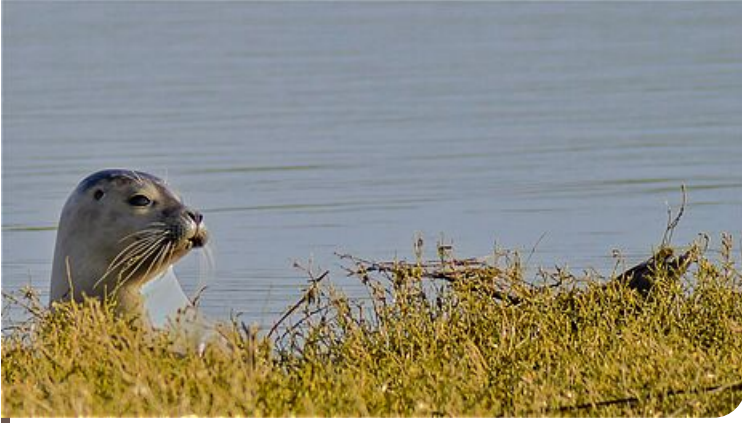
Phoque veau-marin ( Phoca vitulina )