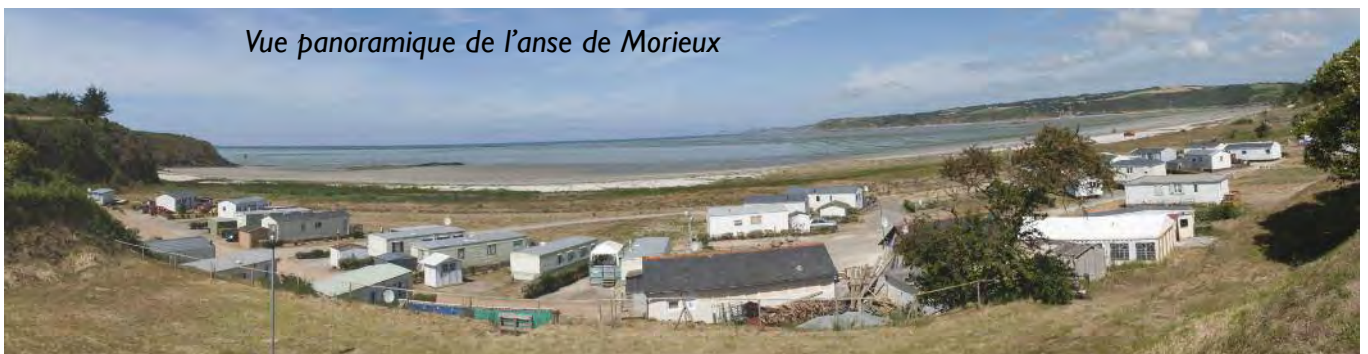
Vue panoramique de l'anse de Morieux

Pour le géographe, le paysage traduit à lui seul les inter-relations complexes des conditions naturelles et des activités des sociétés humaines.