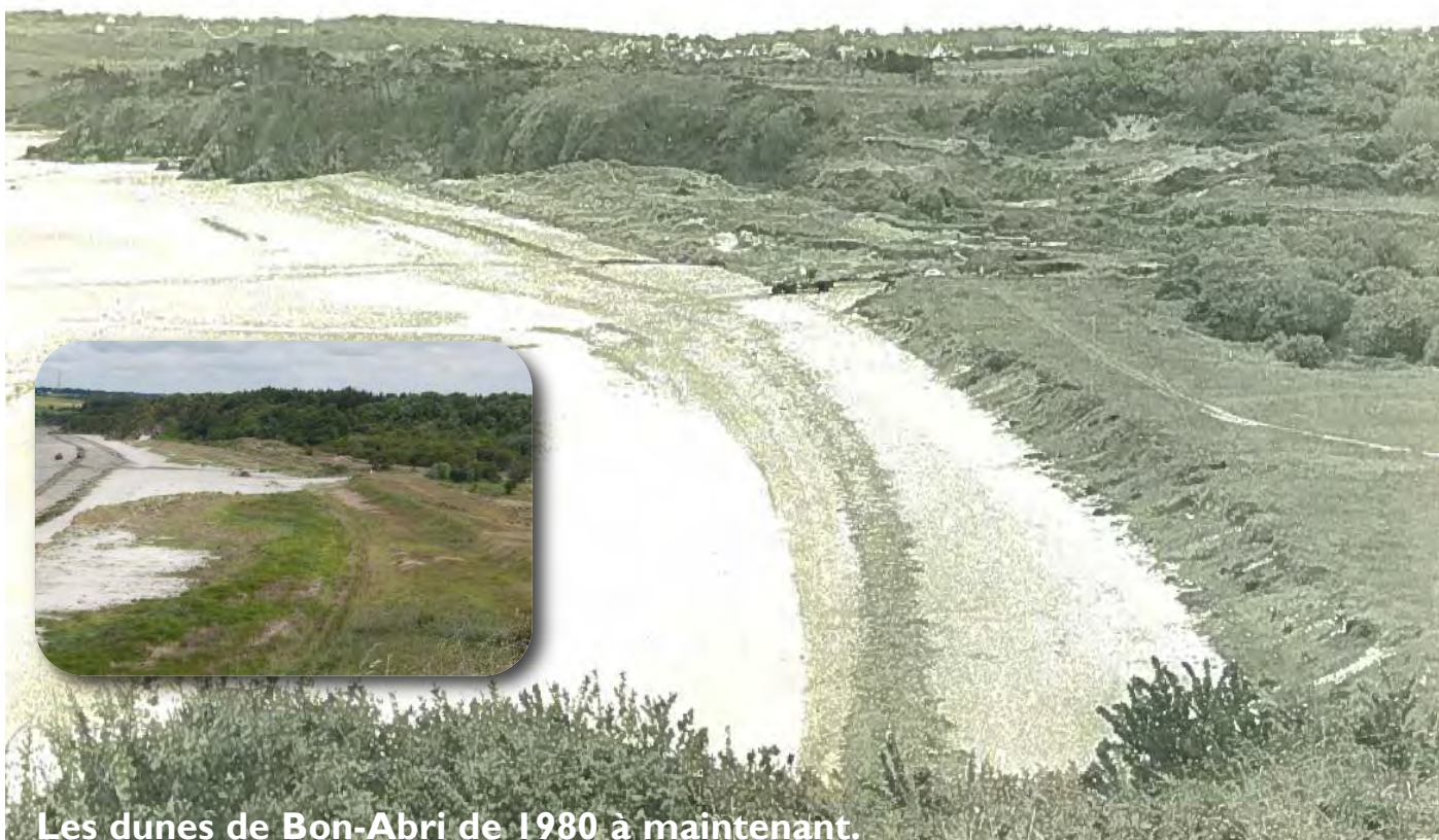
Les dunes de Bon-Abri de 1980 à maintenant.