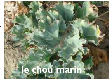
le chou marin

http://www.conservatoire-du-littoral.fr/siteLittoral/383/28-sillon-de-talbert-22_cotes-d-armor.htm