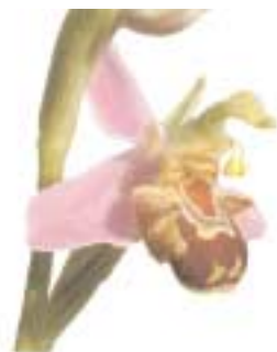
L'ophrys abeille est en fleur actuellement dans les dunes de Bon-Abri (Hillion).