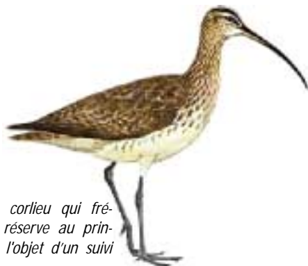
Le Courlis corlieu qui fréquente la réserve au printemps fait l'objet d'un suivi national